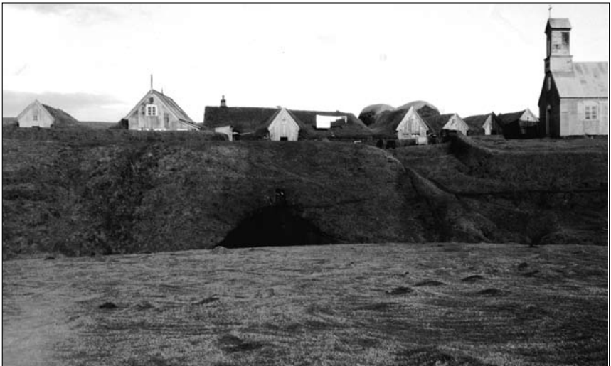
Mynd 9. Ljósmynd Hatts af Keldum með uppgreftinum á jarðgöngunum.

Hópurinn yfirgaf Keldur síðdegis og kom ekki aftur til Reykjavíkur