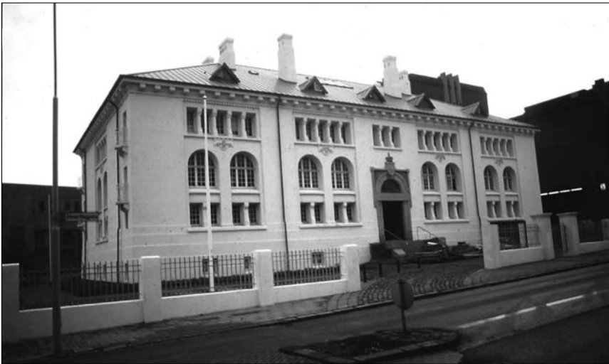
Mynd 6. Safnahúsið þar sem Þjóðminjasafn Íslands var til húsa 1932.